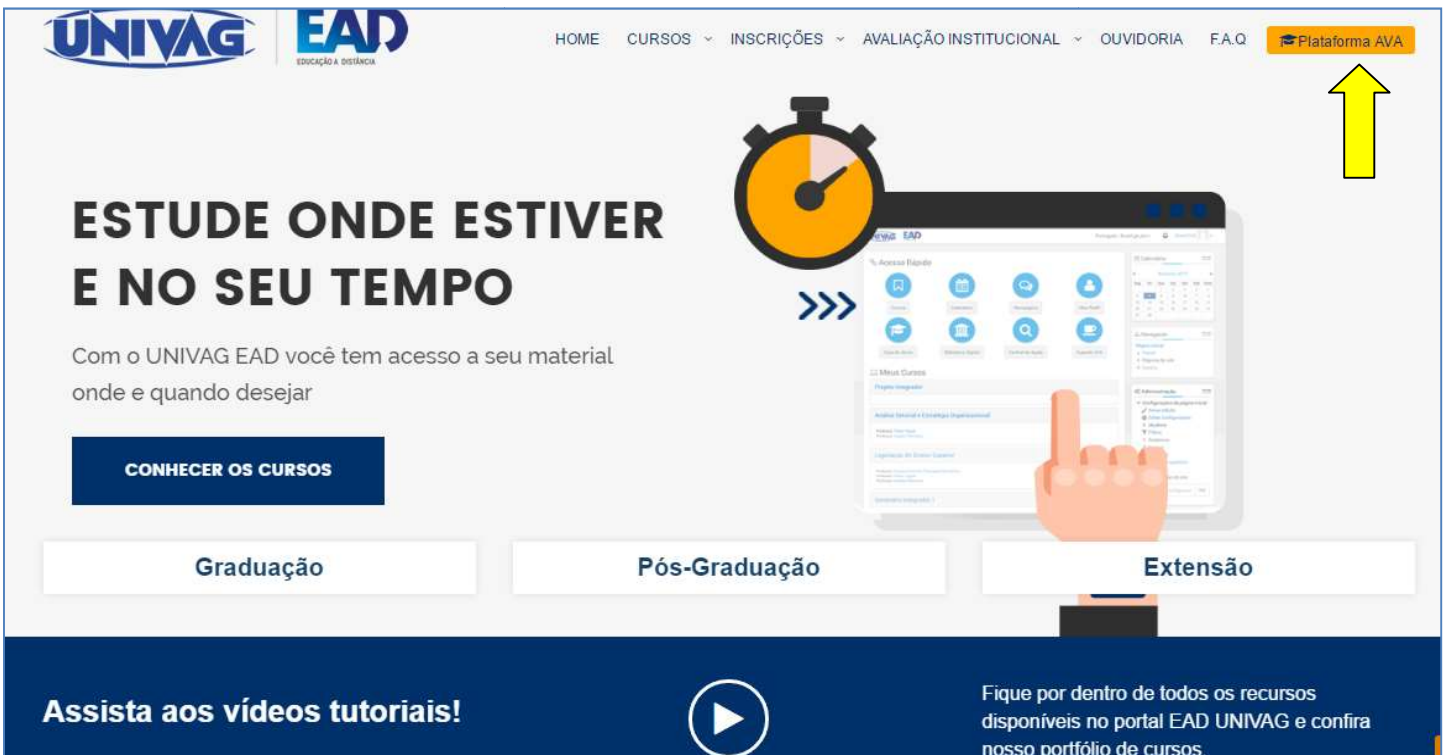
Figura 2: página de acesso à Plataforma AVA

Assim que a página do Univag EAD carregar, você deve clicar “ Plataforma AVA ”, no canto superior à direita, conforme indica a seta amarela: