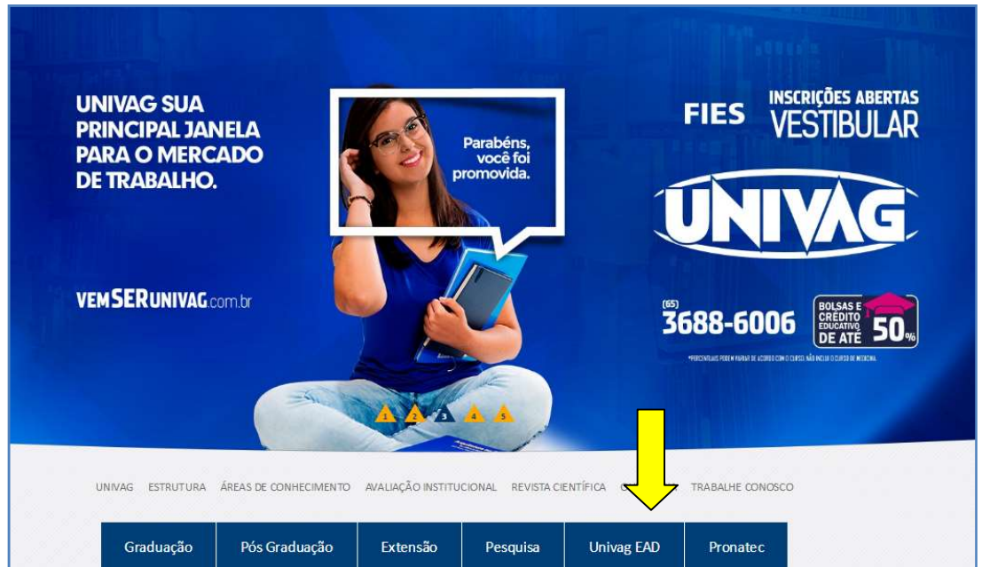
Figura 1: Acesso ao AVA pelo site Univag

Espera a página web abrir e clique no link Univag EAD , conforme indica a seta amarela: